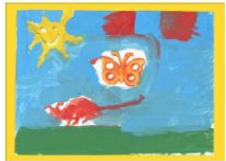
Carte n°10 : Rebecca (9 ans ½)