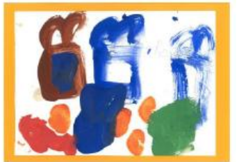
Carte n°12 : Romane (4 ans ½)