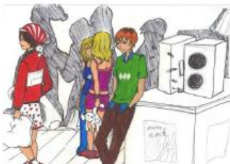
Carte n°5 : Lara (14 ans)