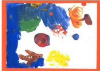
Carte n°3 : Anouchka (4 ans)