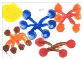
Carte n°13 : Stella (10 ans)