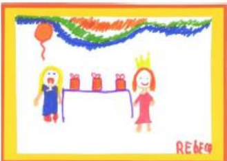
Carte n°9 : Rebecca (9 ans ½)