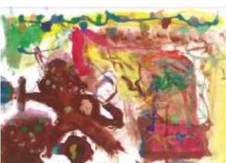
Carte n°15 : Tara (7 ans)