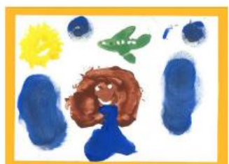
Carte n°14 : Stella (10 ans)