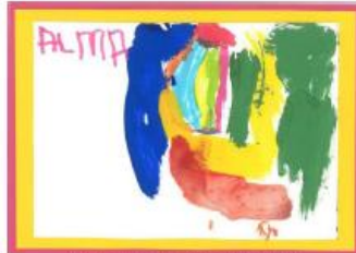
Carte n°2 : Alma (4 ans)